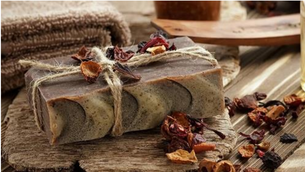
Bon Voyage Gifts

Τα δώρα ταξιδιού μας είναι το τέλειο δώρο για τους αγαπημένους σας. Απλά αγοράστε ένα κουπόνι αξίας €50 ή €100 και δείτε αυτούς που αγαπάτε να χαμογελάνε καθ' όλη τη διάρκεια της κρουαζιέρας τους.