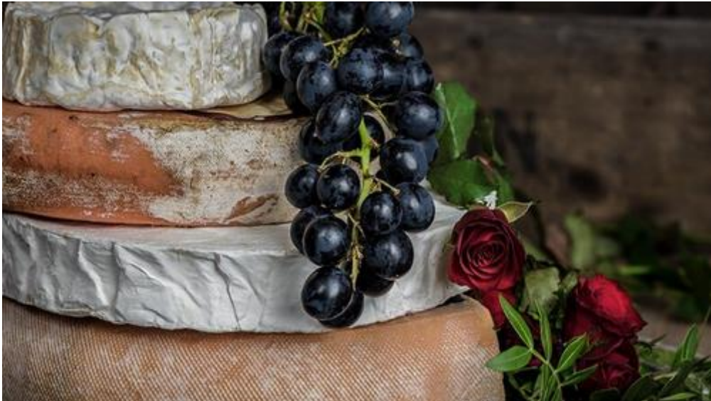
Για τους Γνώστες Εκλεκτών Καταστάσεων

Η απόλαυση καλού φαγητού και κρασιού δεν θα έπρεπε να είναι πολυτέλεια. Το πακέτο γκουρμέ έχει επιλεγεί προσεκτικά για άτομα με εκλεπτυσμένη γεύση.